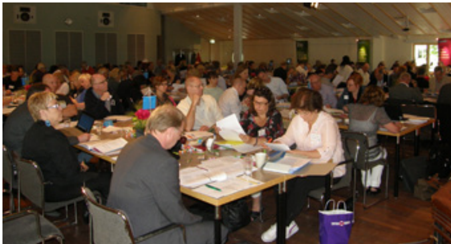
Vy över förbundsstämman med ombuden från Arbetsförmedlingen i förgrunden

Lite drygt 100 fackliga företrädare, från STs olika avdelningar, träffades för årets förbundsstämma. Stämman hölls på Aronsborg, utanför Stockholm, den 25-26 maj.