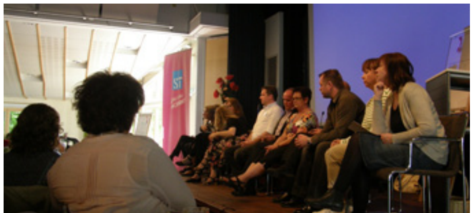
Frågestund med förbundsstyrelsen