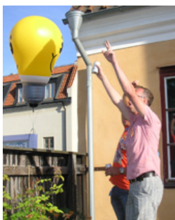
... och dom verkar gilla det!