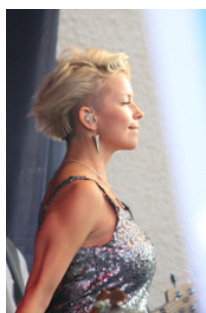
... att September showar på gården bredvid...