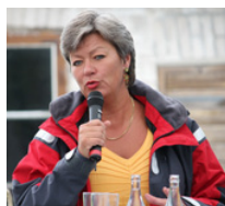
Ylva Johansson (s)

Ylva ser att vi måste hitta flexibla lösningar och att vi inte kommer att vara överens över blockgränserna. Som exempel på långsiktighet nämner hon det tidigare Kunskapslyftet som gav många individer en bättre bas att utvecklas ifrån.