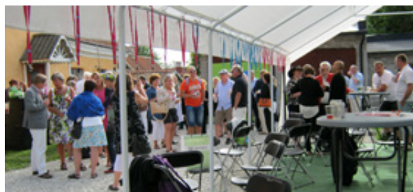
STs mingelkväll i Almedalen