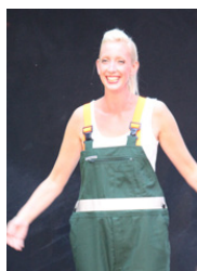
Moderaternas partisekreterare Sofia Arkelsten