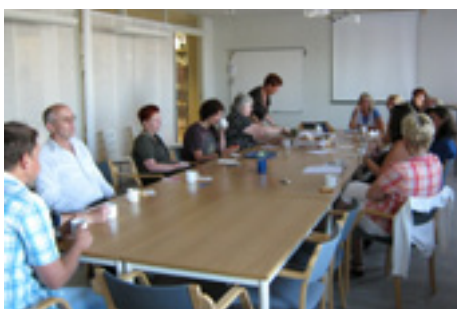
Medlemsmöte på Af Visby