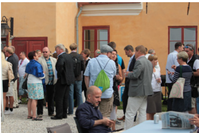
STs mingelkväll i Almedalen